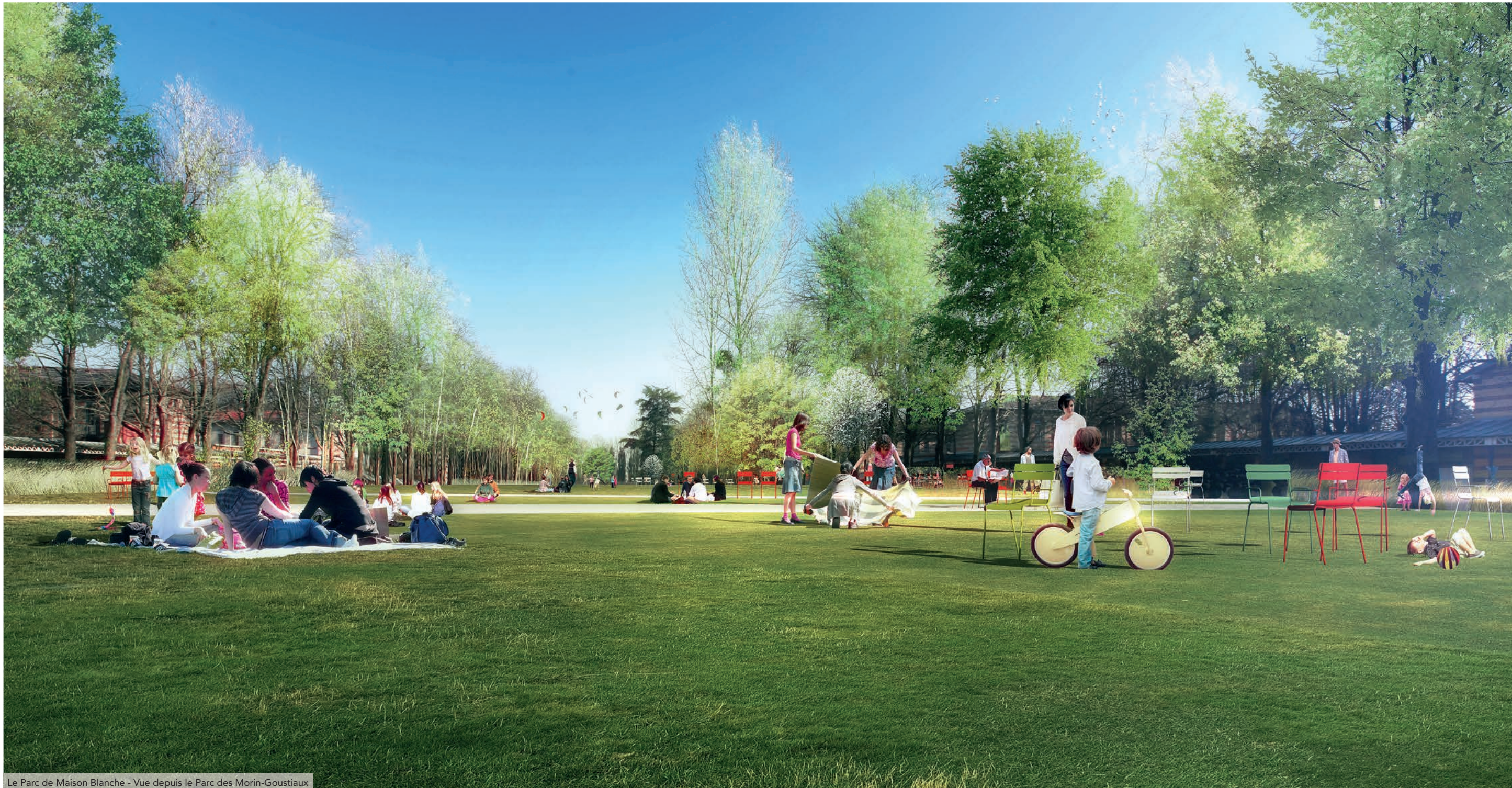
Le Parc de Maison Blanche - Vue depuis le Parc des Morin-Goustiaux