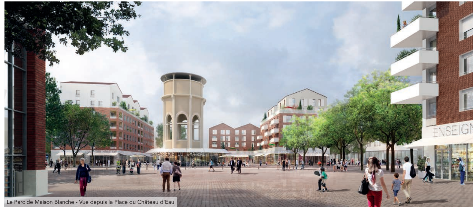
Le Parc de Maison Blanche - Vue depuis la Place du Château d'Eau