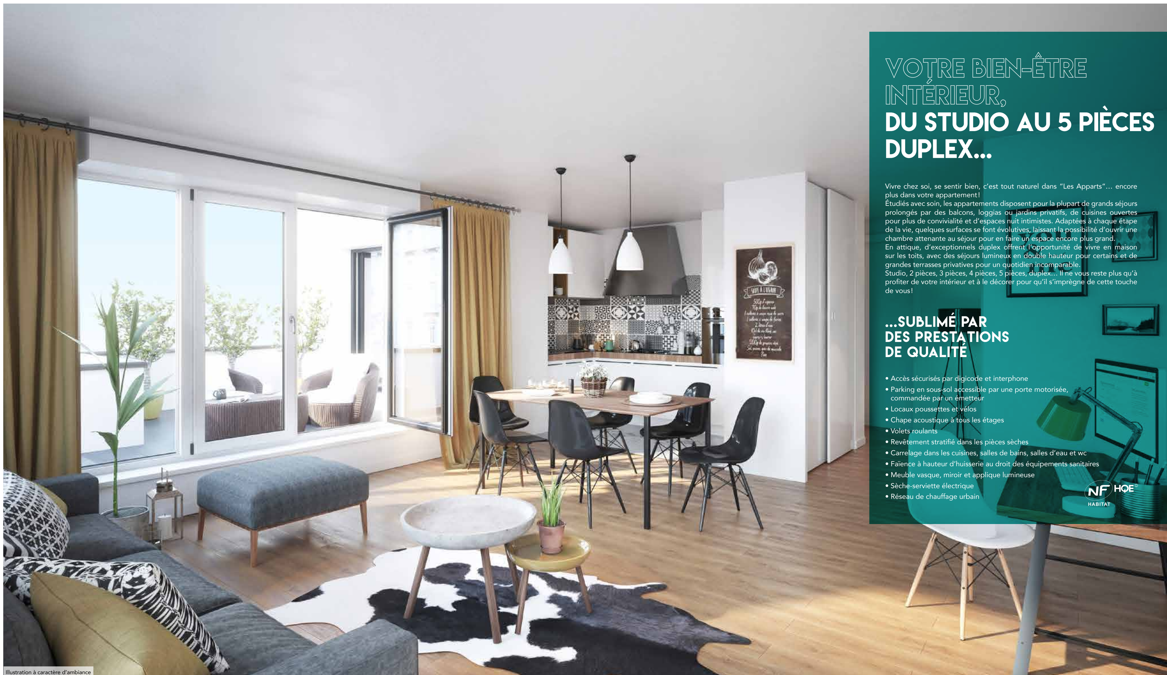
Illustration à caractère d'ambiance