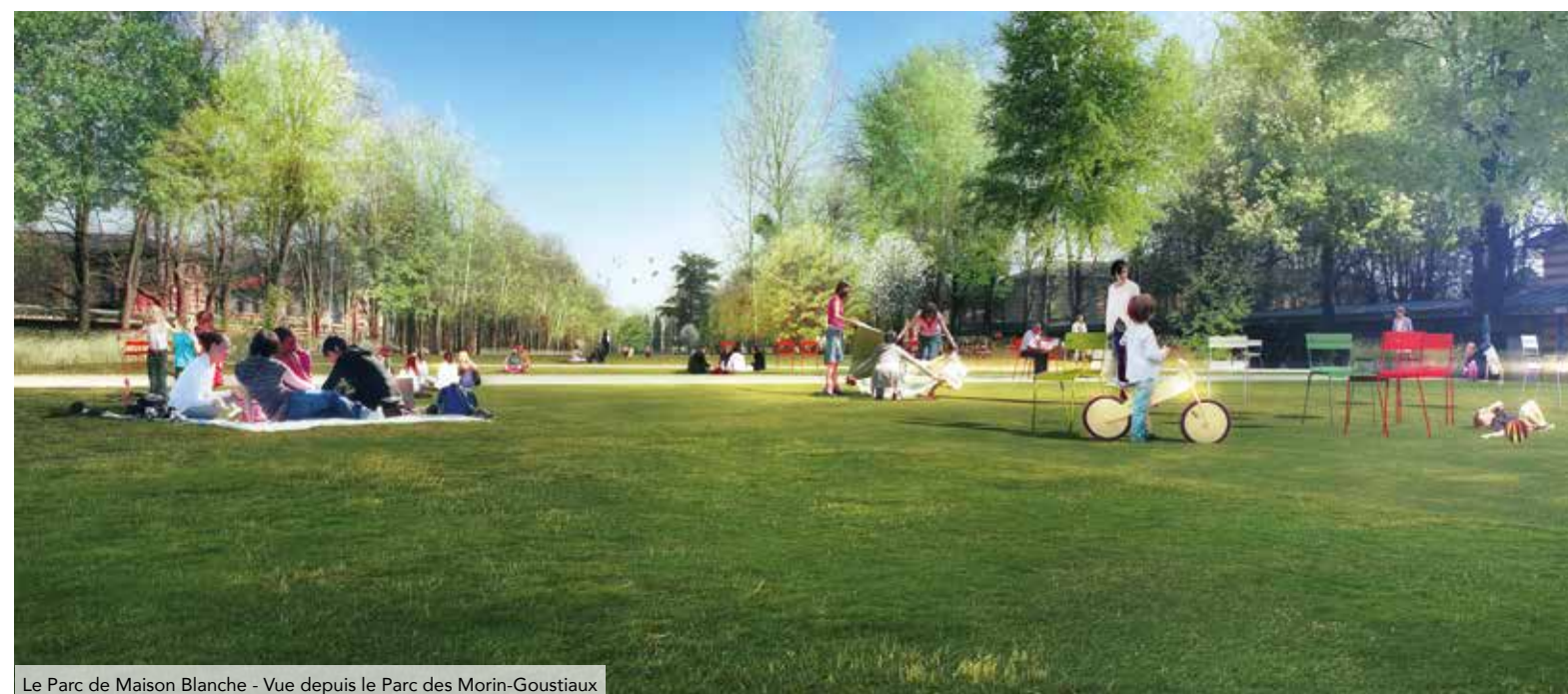
Le Parc de Maison Blanche - Vue depuis le Parc des Morin-Goustiaux