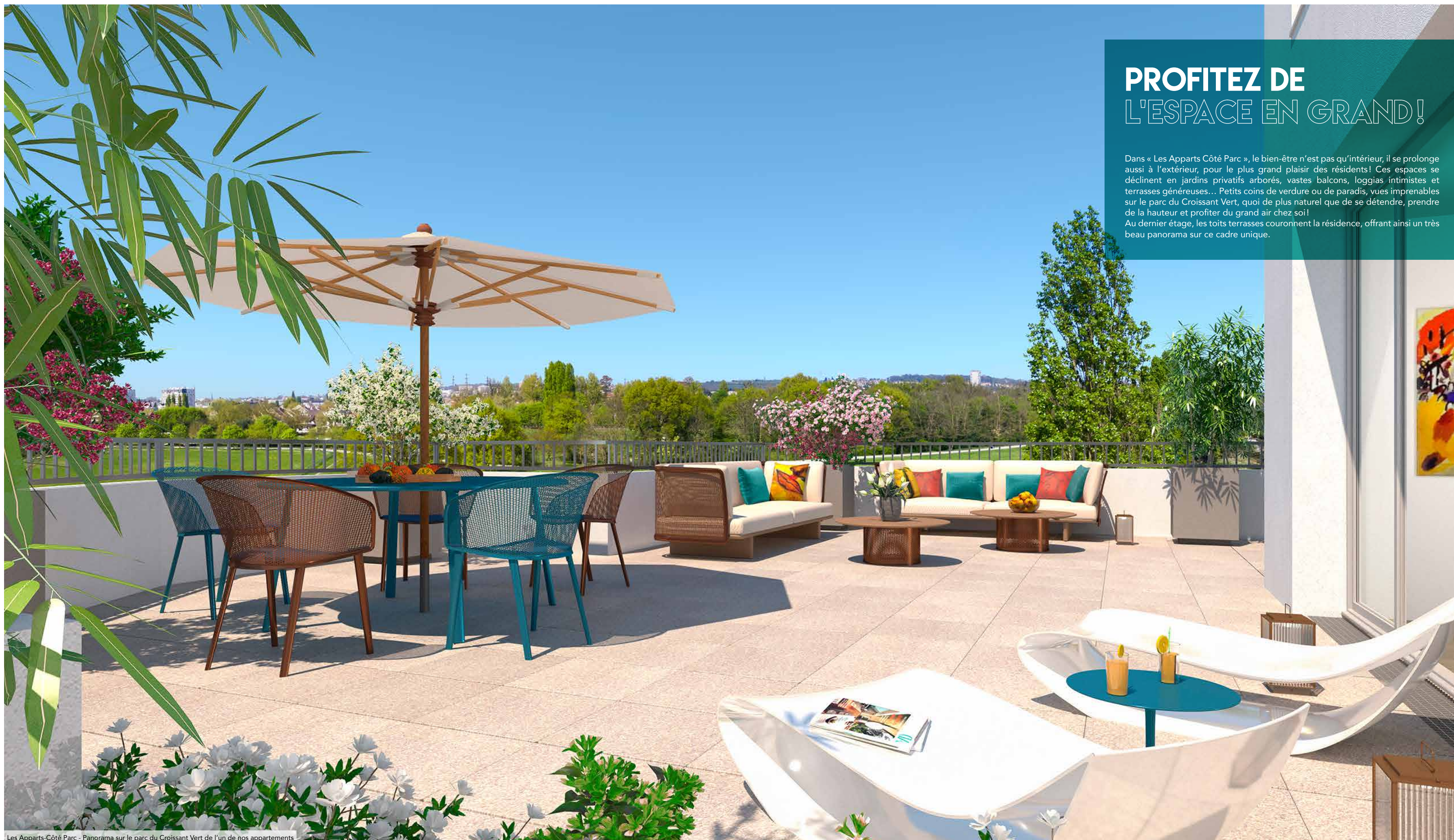
Les Apparts-Côté Parc - Panorama sur le parc du Croissant Vert de l'un de nos appartements

Dans « Les Apparts Côté Parc », le bien-être n'est pas qu'intérieur, il se prolonge aussi à l'extérieur, pour le plus grand plaisir des résidents! Ces espaces se déclinent en jardins privatifs arborés, vastes balcons, loggias intimistes et terrasses généreuses... Petits coins de verdure ou de paradis, vues imprenables sur le parc du Croissant Vert, quoi de plus naturel que de se détendre, prendre de la hauteur et profiter du grand air chez soi! Au dernier étage, les toits terrasses couronnent la résidence, offrant ainsi un très beau panorama sur ce cadre unique.