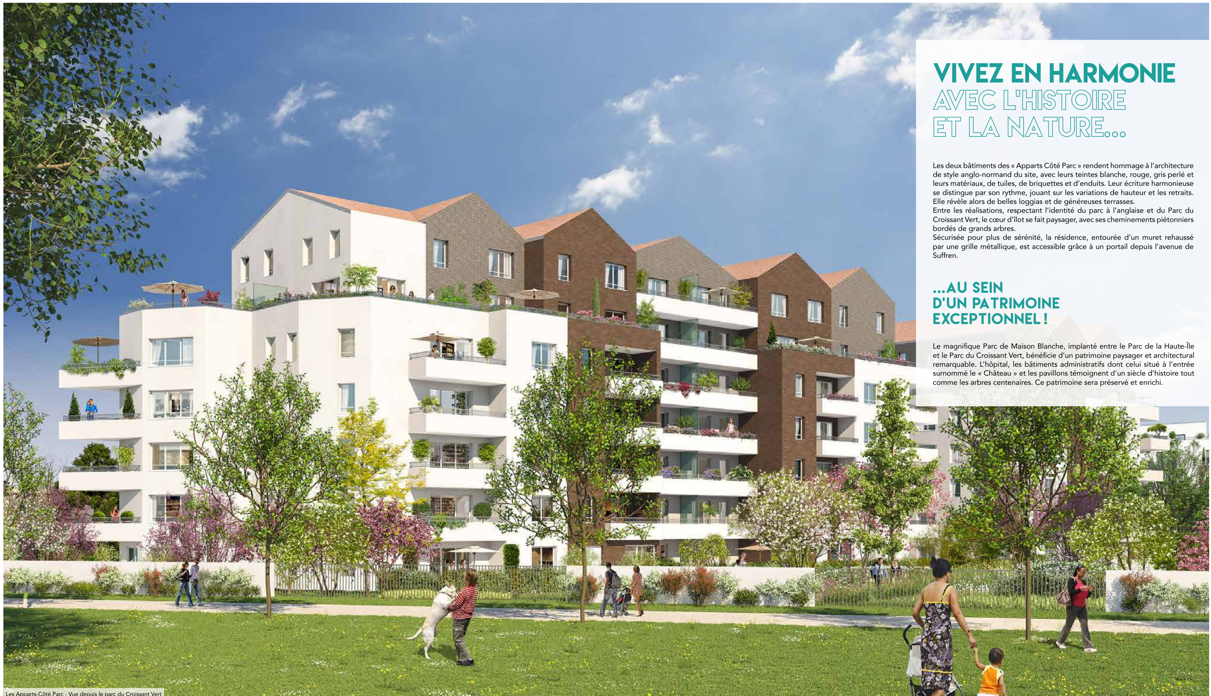
Les Apparts-Côté Parc - Vue depuis le parc du Croissant Vert

Le magnifique Parc de Maison Blanche, implanté entre le Parc de la Haute-Île et le Parc du Croissant Vert, bénéficie d'un patrimoine paysager et architectural remarquable. L'hôpital, les bâtiments administratifs dont celui situé à l'entrée surnommé le « Château » et les pavillons témoignent d'un siècle d'histoire tout comme les arbres centenaires. Ce patrimoine sera préservé et enrichi.