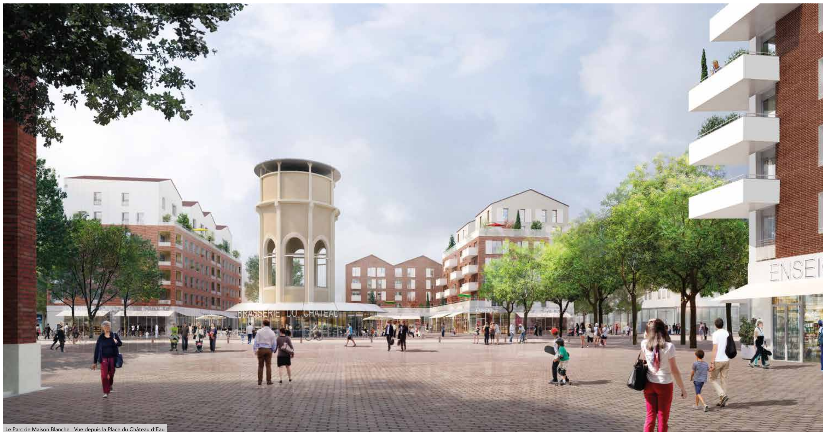
Le Parc de Maison Blanche - Vue depuis la Place du Château d'Eau