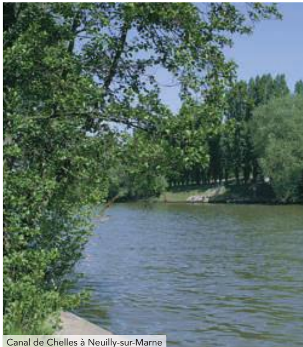
Canal de Chelles à Neuilly-sur-Marne

Riche d'infrastructures sportives variées telles que le centre nautique, d'une offre scolaire importante et de nombreux espaces culturels, elle révèle aussi des bijoux, au nombre desquels le Château Guérin ou encore sa maison bourgeoise du XIX ème siècle, refuge d'illustres figures, parmi lesquelles George Sand, Franz Liszt ou encore Frédéric Chopin.