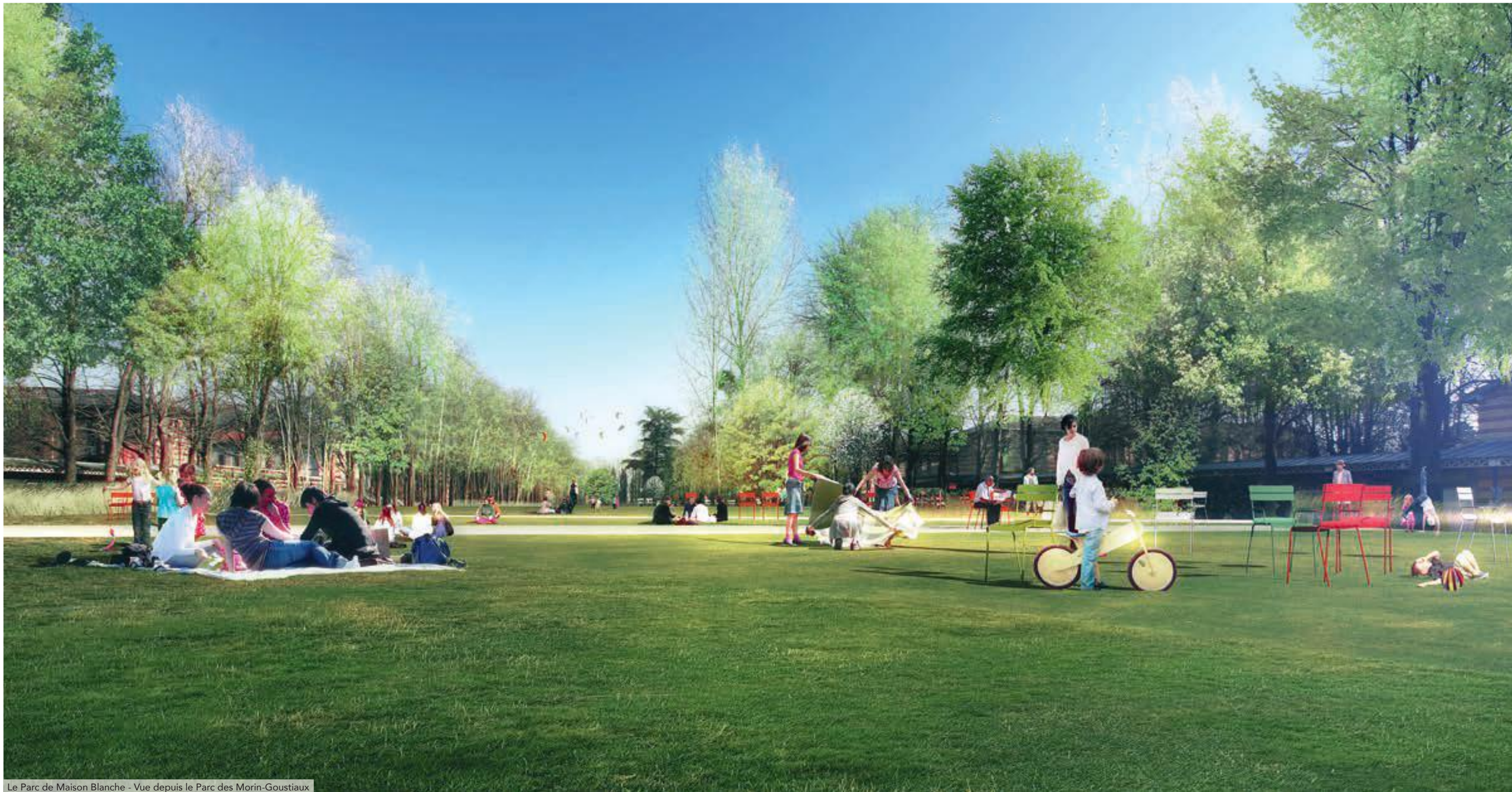
Le Parc de Maison Blanche - Vue depuis le Parc des Morin-Goustiaux