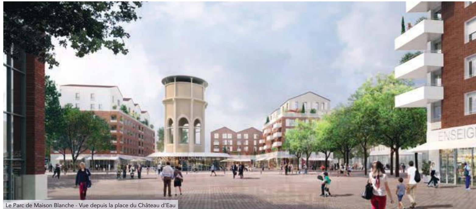
Le Parc de Maison Blanche - Vue depuis la place du Château d'Eau