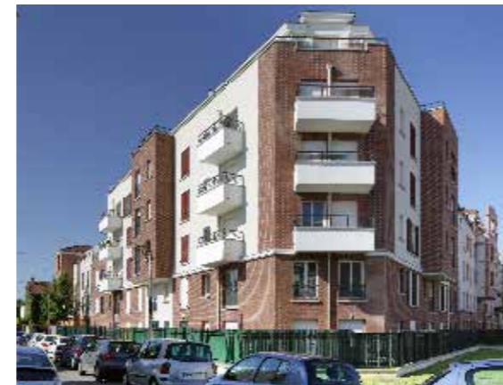
"Terre de Sienne" rue Roger Salengro / avenue du Maréchal Leclerc à Neuilly-sur-Marne.

L'alliance de 2 grands noms de l'immobilier