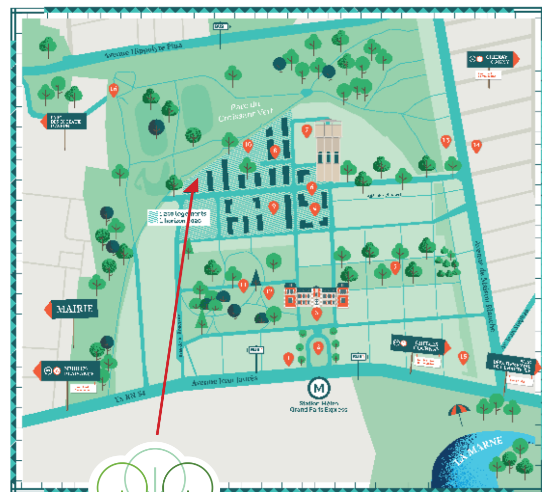
Plan d'aménagement du quartier indicatif susceptible de modifications.

Entièrement close par un mur d'enceinte et une serrurerie métallique, Parc Horizon invite à toujours plus de sérénité et de bien-être pour le plus grand confort de ses résidents.