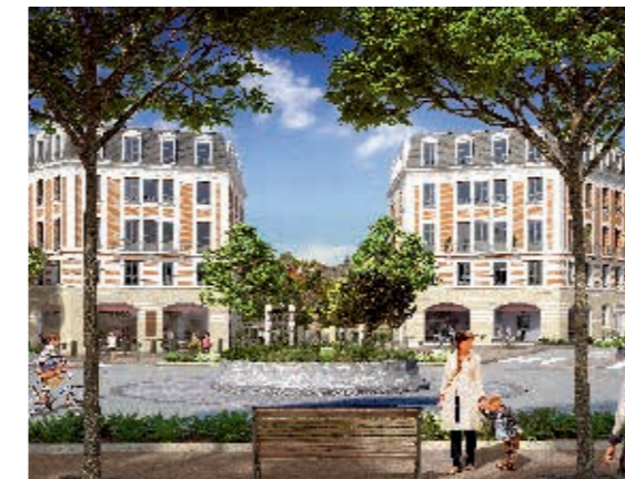
Le Palatinat - 2 rond-point Thiers au Raincy.